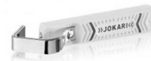
Jokari no 16